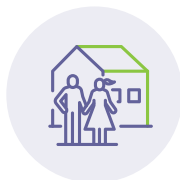
תחום חברתית ומשפחתי (חברים, הורים ואחים)