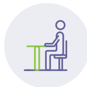
תחום התנהגותי (בבית ובבית הספר)