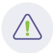
נטיה ללקיחת סיכונים ותאונות דרכים